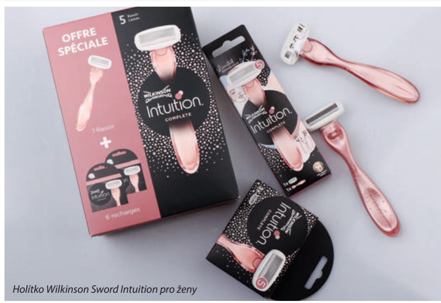
Holítko Wilkinson Sword Intuition pro ženy

Váš výrobní areál je v Nových Modlanech u Teplíc. Jak často investujete do jeho roz-