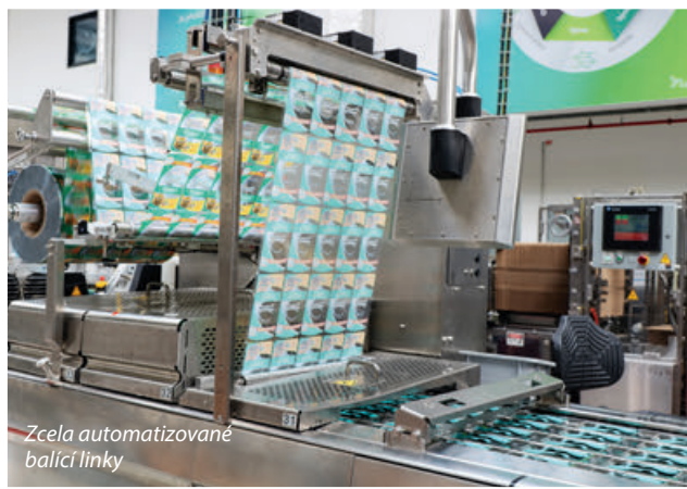
Zcela automatizované balící linky