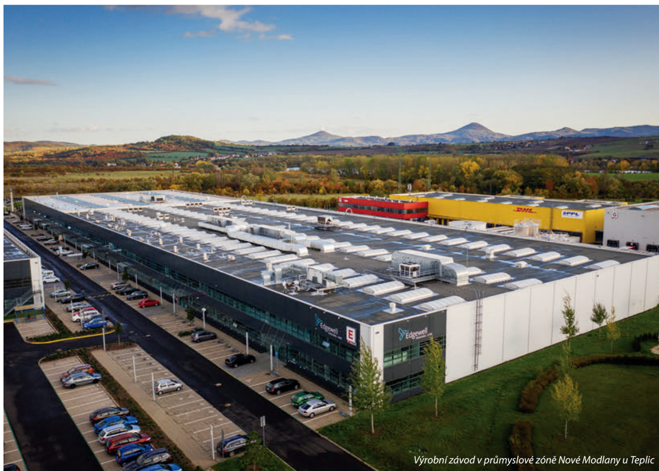
Výrobní závod v průmyslové zóně Nové Modlany u Teplic

Jakýkoliv lockdown a zejména pak omezení cestování v zemích Evropské unie zaznamenáváme v nižším odbytu holítek. Na druhou stranu, každé uvolnění přináší i výrazné oživení v prodeji. To jsou hlavní trendy, které v současné době vnímáme. Pokud odhlédneme od současné situace, tak dlouhodobá růstová strategie koncernu Edgewellu, kam spadáme, je postavena i na akvizicích a rozvoji nových značek. V Evropě to byla v poslední době například akvizice značky Bulldog zaměřené na kosmetiku pro muže, či podobně zaměřený brand Jack Black v USA.