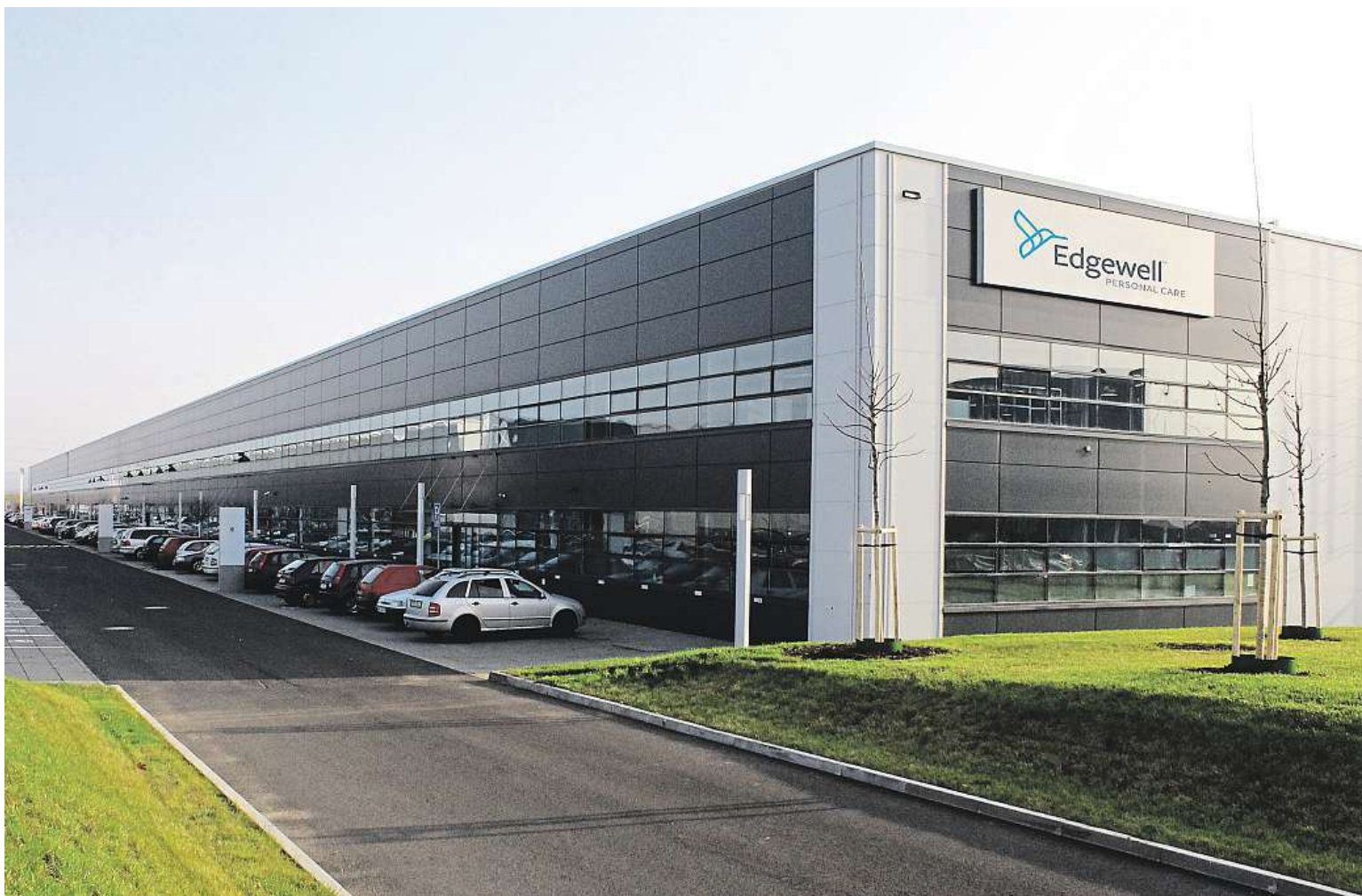
Sídlo V Nových Modlanech na Teplicku se etablovala společnost Personna International CZ, která se zaměřuje na výrobu jednorázových holicích strojků.

M ůj děda (ročník 1901) se holil břitvou. Pamatuji si, že ji brousil na takovém koženém pásku. Holení byl hoto- vový obřad. Nabrousil, tváře si natřel holicím mýdlem z kulaté hnědé krabičky a pak se pomalu, obřadně zbavoval porostu na tváři. Můj otec se holil holicím strojkem a vždy ho pečlivě čistil. Můj manžel dal raději přednost plnovousu a syn se neobejde bez holítek.